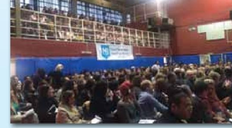
בסוף חודש יולי, התקיים לראשונה בבואנוס איירס, ארגנטינה, כנס בינלאומי לחינוך יהודי. הכנס היה פרי יוזמה של המחלקה לחינוך בהצ"ע בשיתוף וועד החינוך של הקהילה ומיזם התפוצות של מט"ח. בכנס השתתפו 1,498 מורים מכל רשת החינוך היהודי, ללא הבדל בין זרמים חינוכיים מארגנטינה, אורוגואי, ברזיל, ונצואלה, צ'ילה ומקסיקו. במשך שלושה ימים זכו הממחנכים 'לנשום אוויר פסטור' כאשר שמעו הרצאות העשרה והשראה, התנסו בסדנאות וחוו מפגשי אחווה ורעות. לכנס הגיעו מרצים מישראל ביניהם הרב בני לאו, חנוך פיבן, מרים בלומנטל, נוגה כוכבי, גדי ראונר, פביו רדק, אירנה סטוליר ועוד עשרות מרצים מקומיים. בציפור חוויה לימודית בלתי נשכחת שהשאירה טעם לעוד.

האירוע השני אשר סגר את אירועי החגים הלאומיים, היה השתתפותנו ביריד "בואנוס איירס חוגגת", אירוע שמארגנת העירייה בשיתוף שגרירות ישראל כמחווה למדינת ישראל. האירוע התקיים ביום ירושלים. ביריד שהקמנו במקום העמדנו דוכן ססגוני, ובו באמצעות משחק אינטראקטיבי, המדמה אולפן לעברית, הכינו המשתתפים חומוס, ואפילו לקחו 'דוגמית' הביתה, כולל מתכון כמזכרת. אנחנו בדוכן של הצ"ע חילקנו עד סוף היום מעל ל-30 ג' חומוס, במנות בטוחות. עברו בדוכן כ-5,000 איש, וביריד כולו מעל ל-25,000 איש.