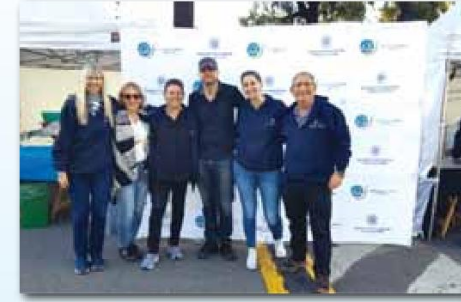
סדנאות לילדים והורים, טורניר כדור רגל, כדורעף, כדור סל והוקי דשא, יריד אוכל ויריד אומנות והסתיים בעצרת מרכזית באצטדיון עם מופע דגלנות, שירה וריקודים. ביום כולו השתתפו כ-6,000 איש, כאשר באירוע המרכזי התכנסו לתוך האצטדיון כ-4,000 איש.

חודש החגים הלאומיים היה עמוס בפעילות. הנציגות השתתפה במעל ל-40 אירועים מכל הסוגים ברחבי ארגונינו: עצרות יום הזיכרון, טקסים ומפגנים סביב יום העצמאות, תפילות בבתי כנסת, הרצאות, פאנלים, ימי ספורט וירידים בקהילות ועצרות תמיכה ענקיות בישראל, אשר התקיימו בפארקים הפתוחים לקהל הרחב בעיר ובמדינה. אני רוצה לציין שני אירועים מרכזיים: הראשון אירוע ה"מגה ישראל", בו הנציגות בשיתוף ארגון מועדוני הספורט ארגנו יום ספורט חגיגי לאורך כל היום במועדון סיסא"ב. האירוע התחיל בשעות הבוקר המוקדמות עם ריצות מרתון, חצי מרתון, ומרוצים עממיים שונים, נמשך בהרקדות המונית, סדנאות לילדים והורים, טורניר כדור רגל, כדורעף, כדור סל והוקי דשא, יריד אוכל ויריד אומנות והסתיים בעצרת מרכזית באצטדיון עם מופע דגלנות, שירה וריקודים. ביום כולו השתתפו כ-6,000 איש, כאשר באירוע המרכזי התכנסו לתוך האצטדיון כ-4,000 איש. בהחלט מפגן עוצמה ותמיכה בישראל! האירוע השני אשר סגר את אירועי החגים הלאומיים, היה השתתפותנו ביריד "בואנוס איירס חוגגת", אירוע שמארגנת העירייה בשיתוף שגרירות ישראל כמחווה למדינת ישראל. האירוע התקיים ביום ירושלים. ביריד שהקמנו במקום העמדנו דוכן ססגוני, ובו באמצעות משחק אינטראקטיבי, המדמה אולפן לעברית, הכינו המשתתפים חומוס, ואפילו לקחו 'דוגמית' הביתה, כולל מתכון כמזכרת. אנחנו בדוכן של הצ"ע חילקנו עד סוף היום מעל ל-30 ג' חומוס, במנות בטוחות. עברו בדוכן כ-5,000 איש, וביריד כולו מעל ל-25,000 איש.