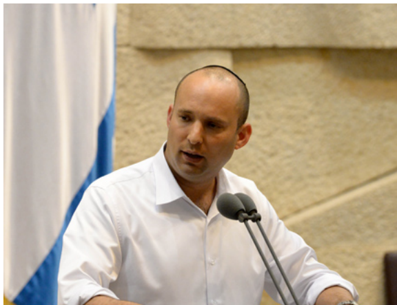
"הממשלות צריכות להיאבק בתופעה". בנט

בחודש אוקטובר בדק משרד התפוצות תכנים אנטישמיים בבריטניה ובצרפת - אליהם נחשפו עשרות מיליוני בני אדם. חלק מהמשתמשים שנטרו הפיצו מספר מסרים אנטישמיים בחודש. "מספרים אלה מגלים רק טפח מתופעת ההסתה האנטישמית ברשת - על מנת לעמוד על היקף התופעה בכללותה יש לצורך לנטר את הרשתות החברתיות בשפות ובמדינות שונות", הסבירו במשרד. "המאבק בתכני שואה ברשת נמצא בשלביו הראשונים ועדיין לא נשא פירות משמעותיים".