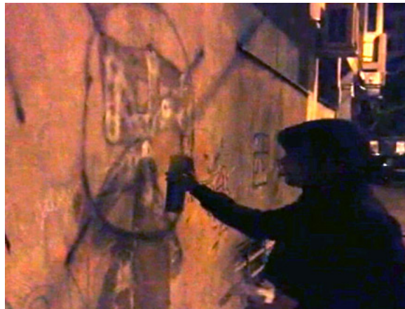
אנטישמיות ברומניה, ארכיון

חדשות | 2 | פורסם 22/01/17 10:28 | עודכן 22/01/17 10:31