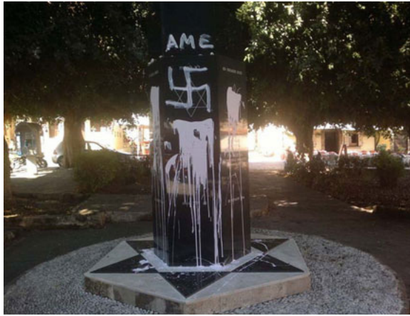
נתונים מדאיגים.