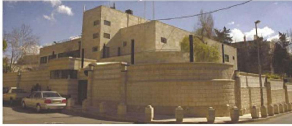
בית אגון בירושלים שתיכנן קאופמן. כיום משכנם הרשמי של ראשי הממשלה

האדריכל ריכרד קאופמן הציב את השלד לתכנון המדינה, אבל שמו נשכח. סקיצות, איורים ושרטוטים משולחנו, המוצגים כעת בארכיון הציוני, הם צעד חשוב במסע לחקר מפעל ההתיישבות שהוביל